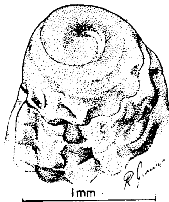
Figura 3 — Caducifer atlanticus sp. n. Protoconcha (Pa- rátipo — Col. Mol. M. N. n.º 3551) .

Coloração geral creme clara, com manchas irregulares, axiais, de côr marrom escura. Cordões espirais com manchas interrompidas, também marrom escuras, irregularmente dispostas axialmente.