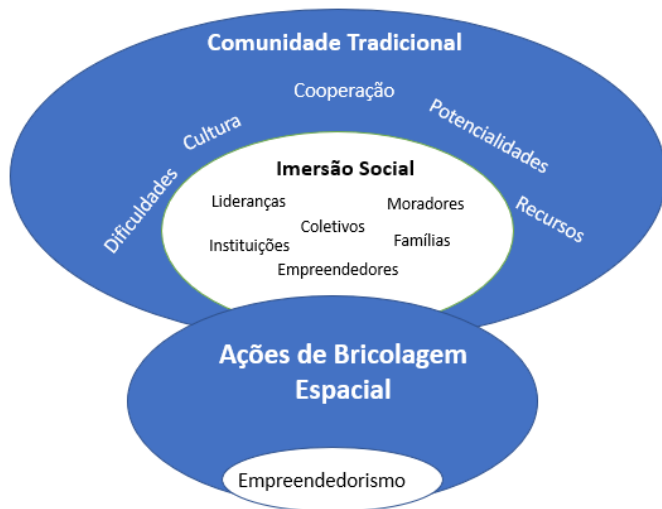
Figura 2. Modelo teórico proposto.

Para complementar o estudo, conforme a Figura 2, com base nas proposições e conceitos destacados na literatura sobre imersão social, bricolagem e empreendedorismo em comunidades tradicionais sugere-se o modelo teórico.