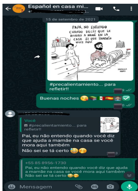
Figura 1: Grupo de la aplicación WhatsApp .

Además de los encuentros en línea, utilizamos la aplicación “ whatsapp ” para los informes sobre el cursillo. En estas interacciones siempre usamos la lengua extranjera, trabajando, de esa forma, la competencia lectora de los estudiantes, además de que solíamos dejar diariamente o una vez a la semana, mensajes motivadores o reflexiones para promover una interacción en Lengua Extranjera (LE) en el grupo. En la imagen abajo, mostraremos un ejemplo de nuestras actividades por esta aplicación.