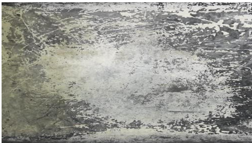
Figura 3: Recipiente com urina mostrando a presença de cristais de cálcio eliminados por coelhos durante uma semana.

A urina dos coelhos tem uma aparência normalmente turva e contém três principais tipos de cristais que contêm cálcio: carbonato de cálcio monohidratado, carbonato de cálcio anidro e fosfato de amônio e magnésio (FLATT; CARPENTER, 1971) (Figura 3).