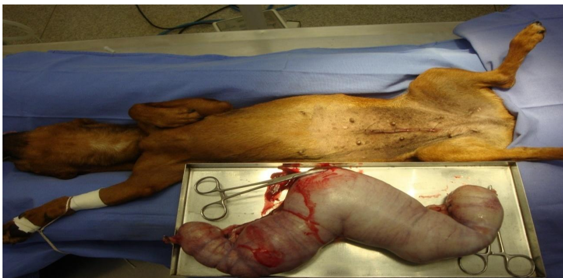
Figura 1- Imagem fotográfica do útero acentuadamente distendido, piometra, Hospital Veterinário da UNOPAR. 2009.

identificação bacteriana, conforme QUINN et al. (2007).