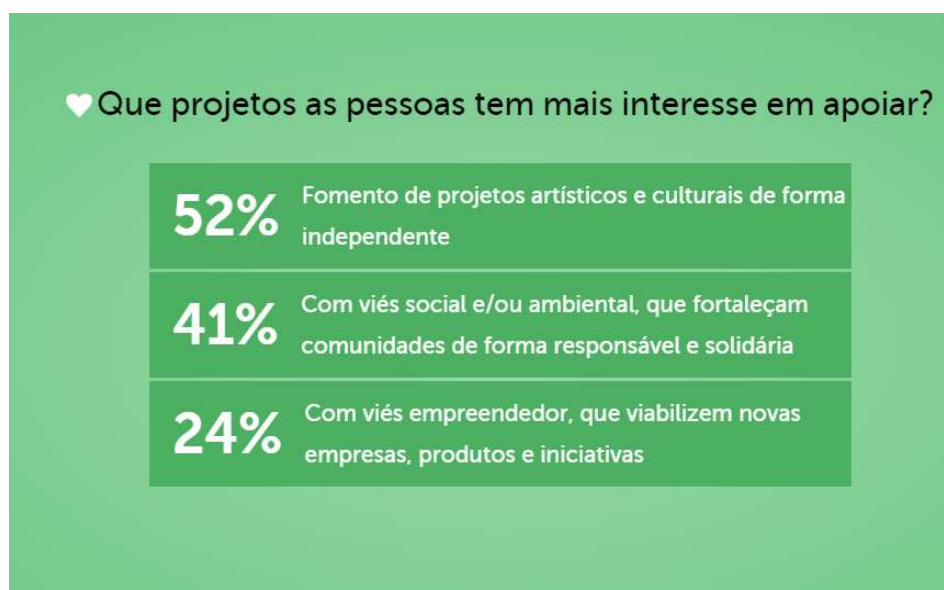
Figura 3 – Projetos que mais despertam interesse na plataforma.