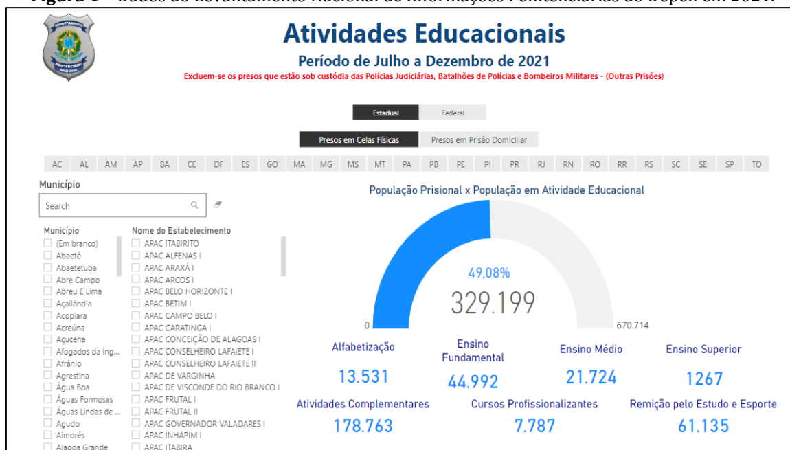
Figura 1 – Dados do Levantamento Nacional de Informações Penitenciárias do Depen em 2021.

fechado, aberto, semiaberto, provisório, em tratamento ambulatorial e em medida de segurança (BRASIL, 2021a). Conforme apresentado na Figura 1, somente 61.135 internos participaram do benefício da Remição pelo Estudo e Esporte. Além disso, mesmo com um quantitativo significativo de 178.763 de participantes, as atividades complementares não são apresentadas e/ou detalhadas no levantamento.