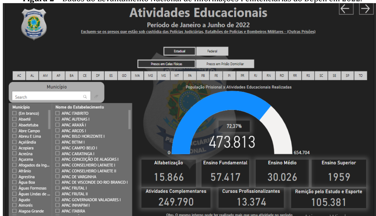
Figura 2 – Dados do Levantamento Nacional de Informações Penitenciárias do Depen em 2022.