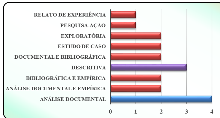
Gráfico 2 – Metodologia de pesquisa empregada nos artigos avaliados