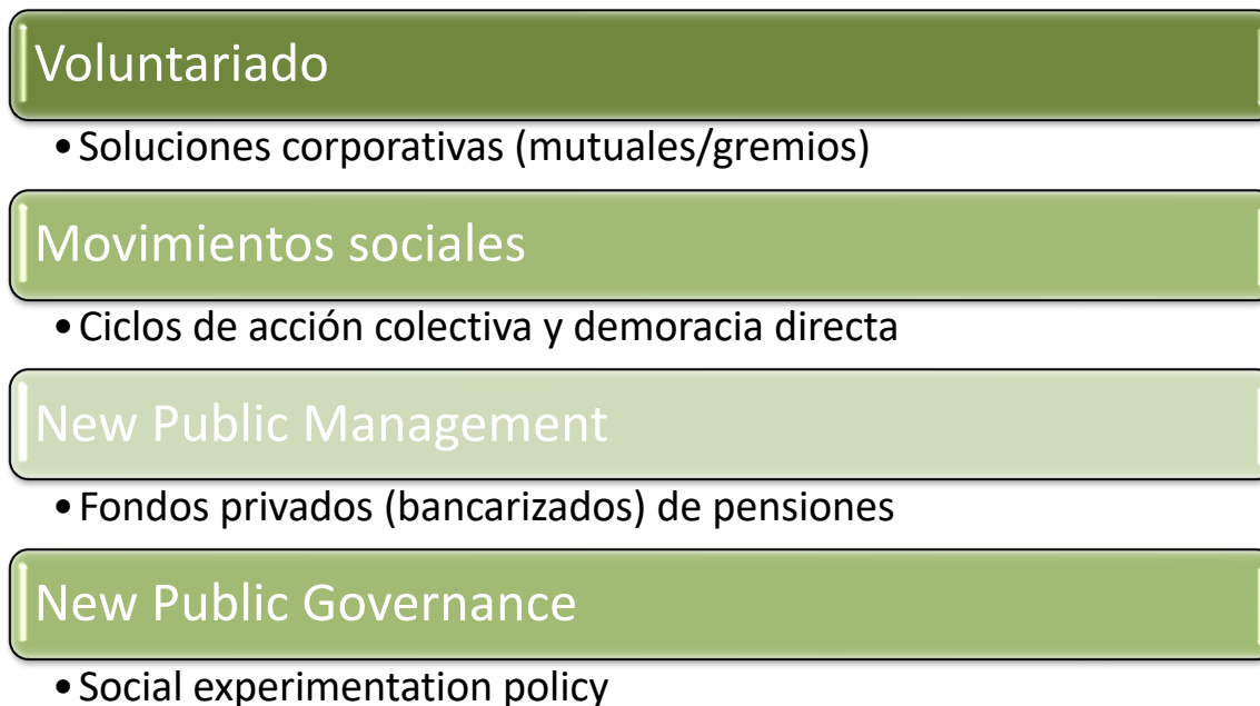
Figura 2 Modos de interacción entre sociedades y estados para la producción de innovación pública