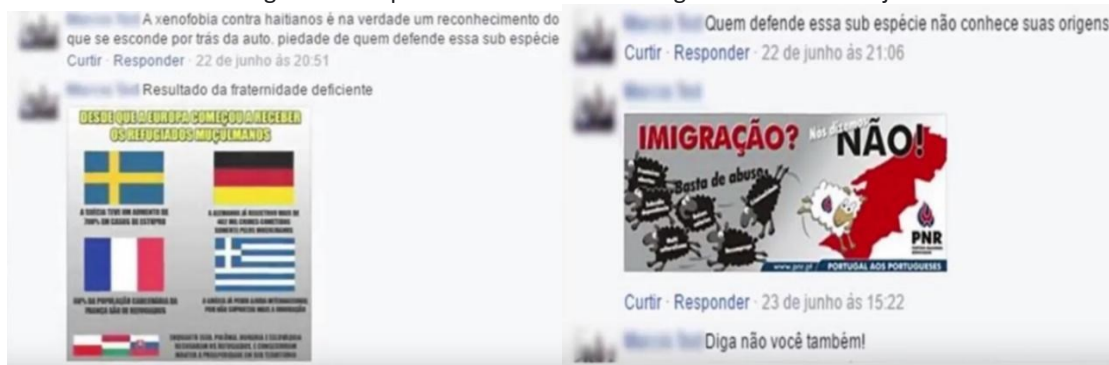
Figura 8: Ataques na rede social da fotógrafa Amanda Araújo

Ao narrar a experiência em suas redes sociais, a acadêmica surpreendeu-se com comentários racistas e xenofóbicos de um perfil falso no Facebook (Figura 8). Manifestações carregadas de contrariedade pela exposição e da presença imigrante onde, como explica Hall (2016), o negro é visto como o “outro, fonte do mal, sujo e deturpado” e aquele que realiza comentários impositivos com aversão busca que o “outro igual” concorde com seu ponto de vista.