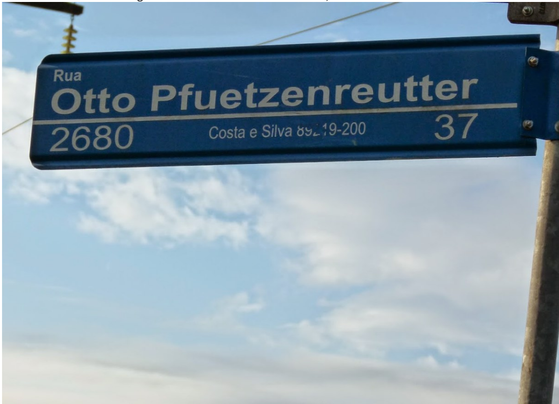
Figura 1: Placa no Bairro Costa e Silva, em Joinville