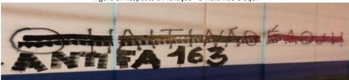
Figura 5: Resposta a Pichação "O Haiti não é aqui"

Souza (2019) explica que a manifestação repercutiu na mídia, revelando discussões sobre a marginalização do imigrante haitiano e sobre quais ações político-sociais, o município estaria realizando para o acolhimento e resolução de problemas para a comunidade haitiana, além do fato destas situações serem realizadas apenas em oposição aos imigrantes negros. O Movimento Antifacista de Joinville afrontou o ataque (Figura 5), com intuito de se impor sobre a manifestação realizada e com a assinatura de um ator político.