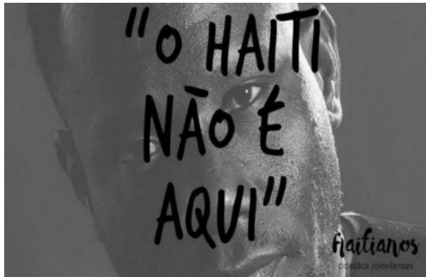
Figura 6: Fotografia do projeto Haitianos cidadãos Joinvilenses

Em meados de 2017, motivada pelo evento, uma acadêmica do curso de Fotografia da Universidade da Região de Joinville (Univille) realizou, como Trabalho de Conclusão de Curso, uma intervenção fotográfica intitulada “Haitianos: cidadãos joinvilenses” que tinha o objetivo de visibilizar as singularidades - utilizando-se de uma técnica artística chamada lambe-lambe (Figura 6). As fotografias foram rasgadas e arrancadas (Figura 7) dos espaços no outro dia (SOUZA, 2019).