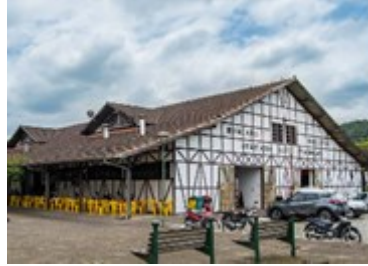
Figura 3: Mercado Público de Joinville