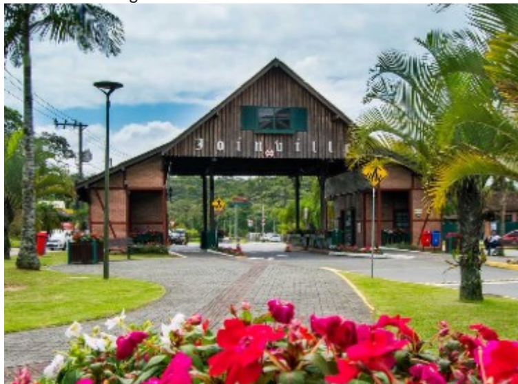
Figura 2: Pórtico na entrada de Joinville