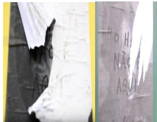
Figura 7: Depredações das fotografias com técnica lambe-lambe