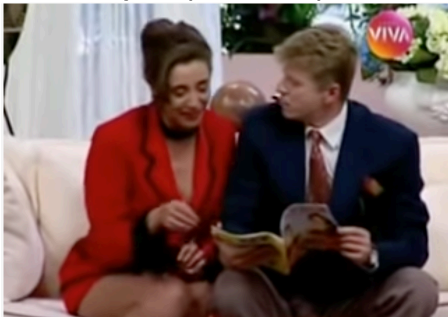
Figura 1 – Captura de tela vídeo compilado