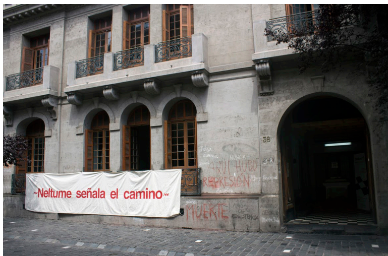
Fig. 5: "Neltume señala el camino" Crédito: Araya-Carrión

veinte, fue durante el gobierno de Allende la sede comunal del Partido Socialista. Además de servir como lugar de reunión, aquí se pintaban las pancartas utilizadas por los miembros del partido. La primera seña de la intervención de Araya-Carrión en Londres 38 evoca precisamente estas prácticas (Fig. 5) 22 .