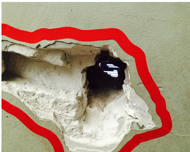
Fig. 8: Detalle agujero

[...] no es solo cuestión de interferencia, sino de enredo [ entanglement ], una cuestión ético-onto-epistemológica. Esta diferencia es muy importante. Enfatiza el hecho de que el conocimiento