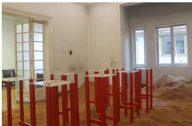
Fig. 7: “El porvenir archivo del aserrín”

las fotos, estos también han registrado una serie de acontecimientos y objetos (Fig. 7).