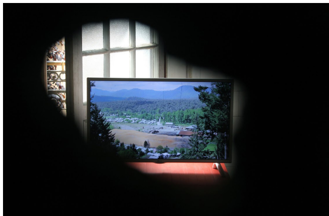
Fig. 3: Videoinstalación agujero

Pensamos, entonces, en el residuo como una contracara no solo simbólica del capitalismo, sino como su negativo material: ante la acumulación capitalista, el cúmulo residual. He aquí la especificidad testimonial del residuo. Si la mercancía borra todas las huellas de su producción y su origen (no solo de la mano que la produce sino del emplazamiento de la materialidad “forjada”) y su acumulación tiende cada día más a la desmaterialización, el residuo (el cúmulo) es repositorio de historias, de todas las capas que metonímicamente construyen la historia. Es por eso que, a diferencia de la mercancía, el residuo siempre es testigo de su emplazamiento—no importa cuánto se lo desplace.