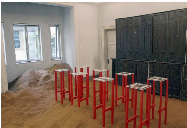
Fig. 1: “El porvenir archivo del aserrín”