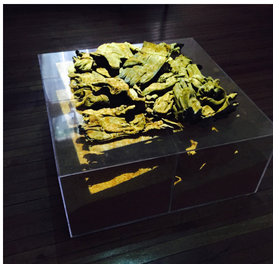
Fig. 9: Guantes sobre caja de acrílico