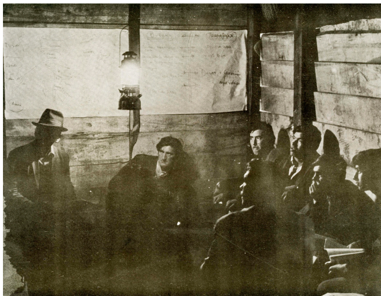
Fig. 4: Jornada de formación política del MIR