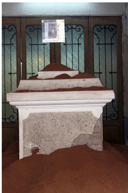
Fig. 6: "Señalamiento de una ausencia"

en lo que antes fuera la entrada de automóviles que la DINA usaba para ingresar a los prisioneros, un busto de Bernardo O'Higgins — "Libertador de la Patria" — sobre un gran plinto de mármol. A pesar de los sucesivos intentos de borradura por parte de la dictadura, familiares de detenidos desaparecidos y diversas agrupaciones y colectivos no dejaron de manifestarse al exterior del inmueble 24 .