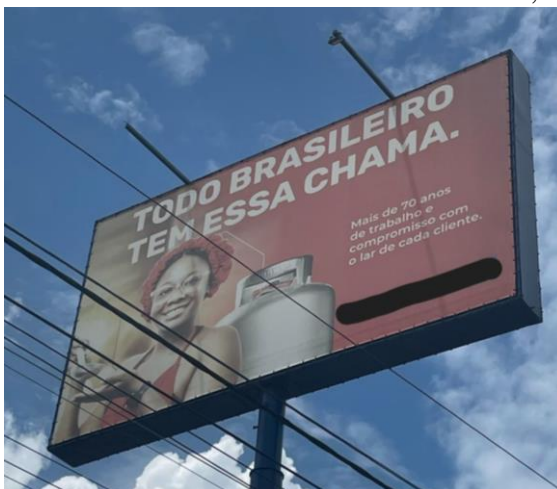
Imagem 3 - Outdoor localizado na Rua Nila Vasconcelos, em Acarape (CE).

chama” e abaixo uma mulher negra, entrando em diálogo com o conceito de imagens de controle.