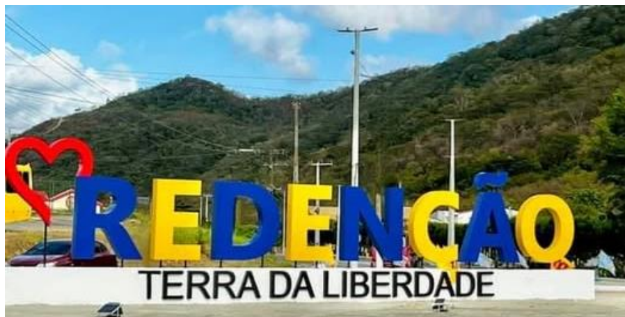
Imagem 1 - Imagem do Letreiro na entrada do município de Redenção/CE: “Redenção - Terra da Liberdade”.