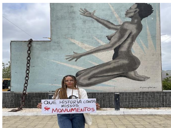
Imagem 2 - Ato político em frente ao Monumento “Negra Nua”, feito na I Marcha Antirracista no Município de Redenção-Ce, realizado pelas escolas e a Unilab no ano de 2024.