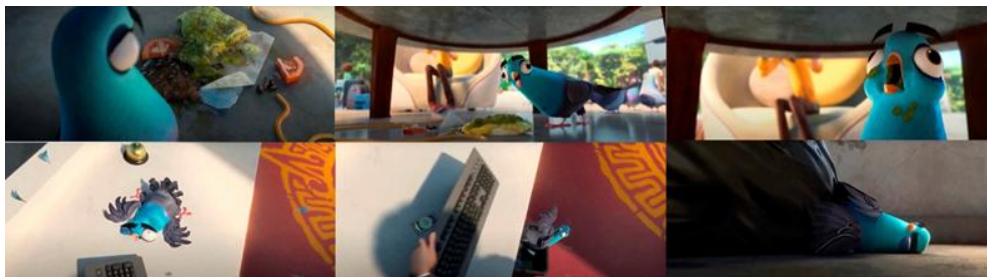
Figura 2: O pombo e o lixo