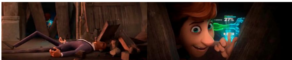
Figura 4: Walter e Lance