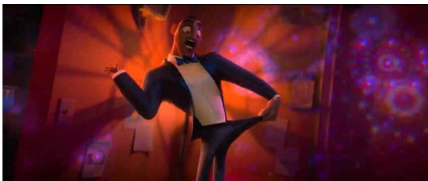
Figura 1 - Sterling e o início da transformação