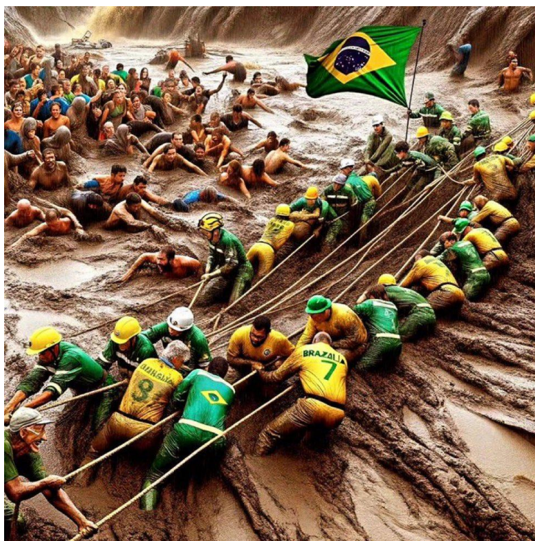
Figura 4: Imagem produzida por IA

Notamos que a fragmentação do processo de distribuição deste tipo de imagem-fluxo culmina na construção enviesada de uma espécie de realidade sintética, amplificada pela presença algorítmica, enquanto variável de expansão de narrativas falsas. Vejamos a imagem abaixo, compartilhada à exaustão por grupos de WhatsApp e redes sociais.