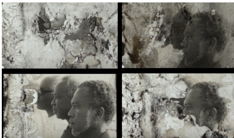
Figura 1 – Exposição da degradação das imagens em sequência de Spell Reel .

Nesse jogo de sobreposições ou ainda no contexto do plano, as imagens de arquivo surgem sempre com algum tipo de alteração. Seja com mudanças sobre a sua dimensão (menores que a tela de projeção), orientação (o primeiro plano de cabeça para baixo) e localização (ora para a lateral esquerda, ora para a lateral direita), seja pela exposição do seu estado de deterioração (como na FIGURA 01, imagem do perfil de Luís Cabral, Aristides Pereira e Julius Nyerere).